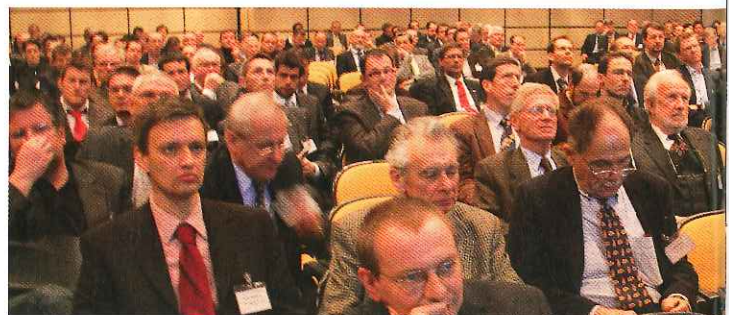
Blick in den Vortragsaal der ÖGT.