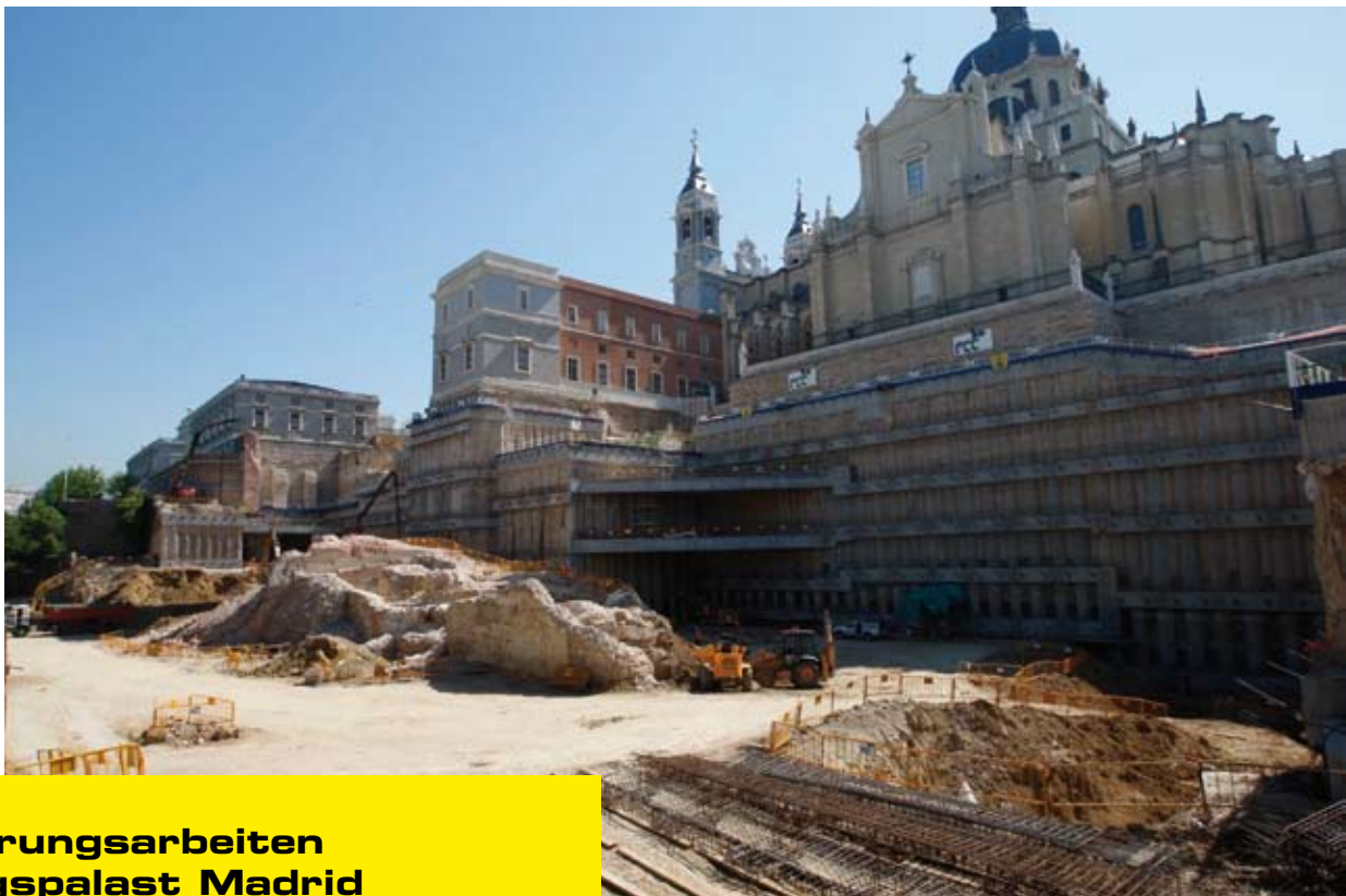
Ankerungsarbeiten Königspalast Madrid

By order of our general owner, FCC Fomento de Construcciones y Contratas , we were responsible for conducting extensive anchoring work at the Royal Palace in Madrid from November 2007 to September 2008. Prestressed anchors from GPS, which extend up to 50 metres into the ground, secure one of Madrid’s special landmarks: The Almudena Cathedral