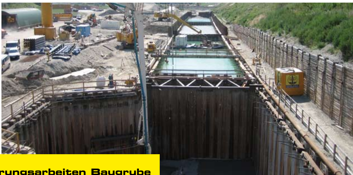
Ankerungsarbeiten Baugrube H4-3 Stans

We provide all these foundation engineering services as well as rock-face sealing and securing services in high alpine terrain.