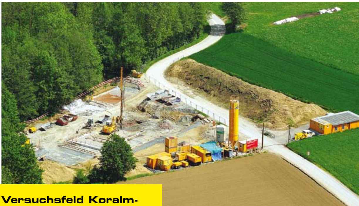
DSV Versuchsfeld Koralm-tunnel-Untersammelsdorf