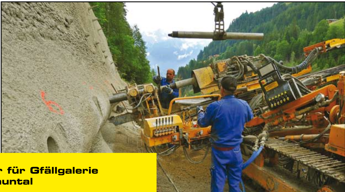
Anker für Gfällgalerie Paznauntal