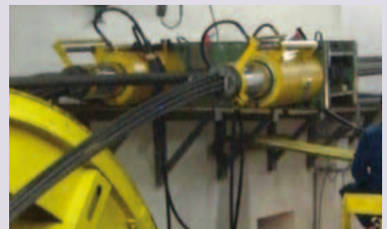
Abb. 3: Anordnung der Spannpressen, Verschiebung des Tragseils

Durch Anpassung der Dimensionen der Litzenstränge, der Verankerungseinrichtungen und der hydraulischen Spannpressen ist es möglich, die Anlagenverhältnisse individuell zu berücksichtigen und kosteneffizient anzubieten.