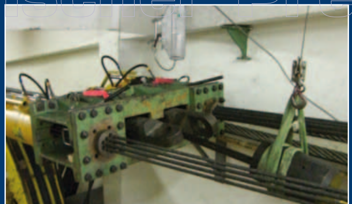
Galzig-, Rendl- und Vallugabahn, Arlberg